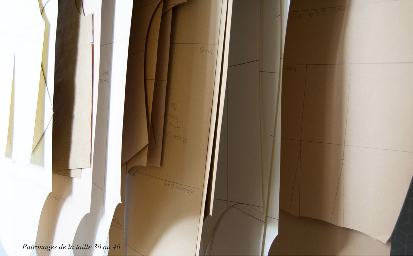
Patronages de la taille 36 au 46.