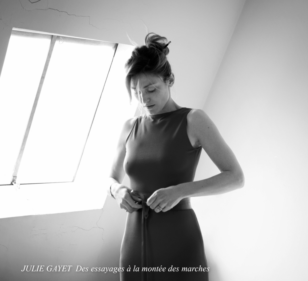
JULIE GAYET Des essayages à la montée des marches