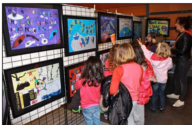
Village des Droits de l'Homme