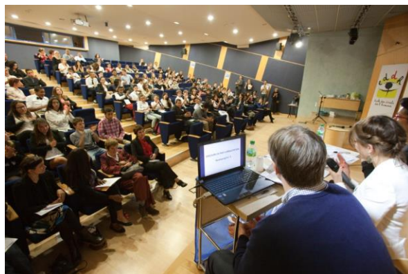
Simul'ONU 2014