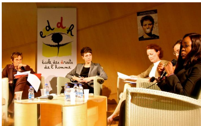
Conférence-débat – Printemps des Droits de l'Homme 2014

Entrée gratuite. Nombre de places limité.