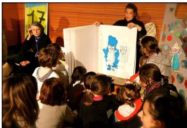
Village des Droits de l'Homme