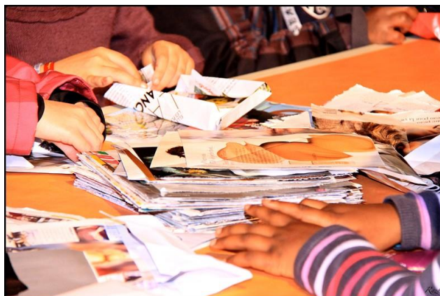
Village des Droits de l'Homme