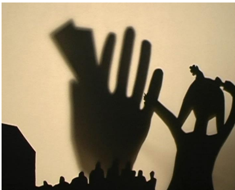
Simulation d'Assemblée Générale des Nations Unies Montauban - Février 2014 Réalisation_SEGPA - Les invisibles - Lola papier