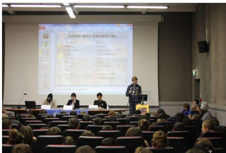
Simulation d'Assemblée Générale des Nations Unies Montauban – Février 2014

Alors que les organismes intergouvernementaux, tels que l'Organisation des Nations Unies, sont si souvent critiqués et fustigés dans les médias, il n'est que plus important que les élèves aient l'opportunité de faire l'expérience directe des pouvoirs et des limites de telles institutions, et acquièrent ainsi un respect pour la diplomatie multilatérale. Action menée en partenariat avec l'UNRIC, Centre d'Information Régional des Nations Unies, le rectorat de l'Académie de Toulouse et la Région Occitanie.