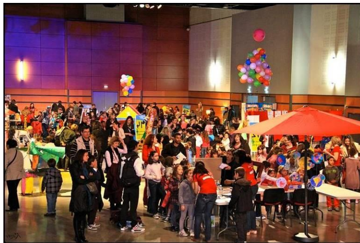
Village des Droits de l'Homme au Phare de Tournefeuille