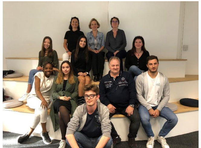
Les jeunes volontaires en Service Civique et leurs responsables Harmonie Mutuelle