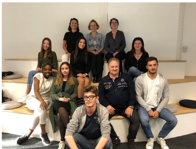
Les jeunes volontaires en Service Civique et leurs responsables Harmonie Mutuelle