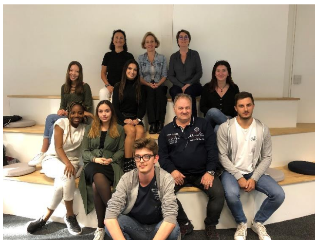
Les jeunes volontaires en Service Civique et leurs responsables Harmonie Mutuelle

des échanges, le nombre de places est limité, l'inscription est gratuite et obligatoire, et se fait par mail service.civique.limousin@harmonie-mutuelle.fr ou par téléphone au 07 72 29 75 36 – 07 85 45 15 92.